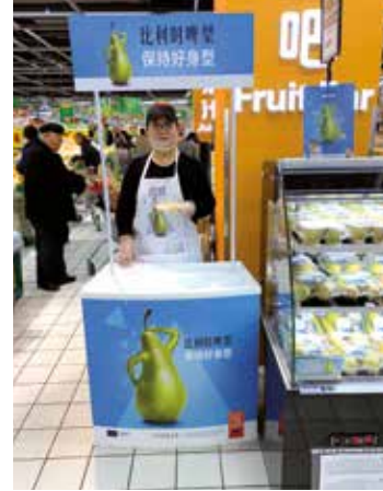
Tastings peer China

van vijf nieuwe EU-programma's met Europese cofinanciering. Door een extra financiële inspanning vanwege de Europese Commissie bedraagt de cofinanciering voor deze projecten 80%. Concreet betekent dit dat elke Vlaamse euro die geïnvesteerd wordt in deze promotieprojecten, vijf euro waard wordt. Met deze driejaren-campagnes richt VLAM zich op India ter promotie van appels en peren, op China voor peren, op Brazilië voor peren en op Canada voor paprika, witloof en prei. De campagne ter promotie van de Conferentie-peer in Duitsland, samen met de Nederlandse sector, werd verdergezet, alsook de campagne 'Taste Of Europe II' die voorziet in de ondersteuning van beursdeelnames in derde landen.