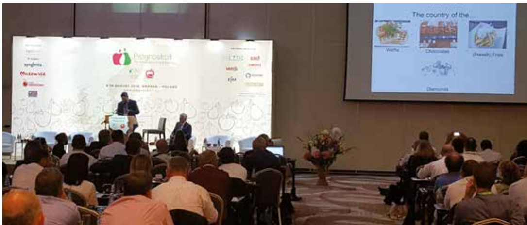
Congres Prognosfruit Warschau/Polen

Zowel voor groenten als voor fruit wordt jaarlijks per teelt een berekening gemaakt van de arealen die in productie zijn. Deze areaalbepaling, in combinatie met de aanvoercijfers afkomstig uit de VBT-database, vormen het uitgangspunt van een productieraming per teelt. Dit gebeurt respectievelijk door de werkgroep Oogstraming Groenten en de werkgroep Oogstraming Fruit. Onder meer veilingafgevaardigden, het VBT, Boerenbond, het Departement Landbouw en Visserij en de Algemene Directie Statistiek - Statistics Belgium (Statbel) zetelen in deze werkgroepen.