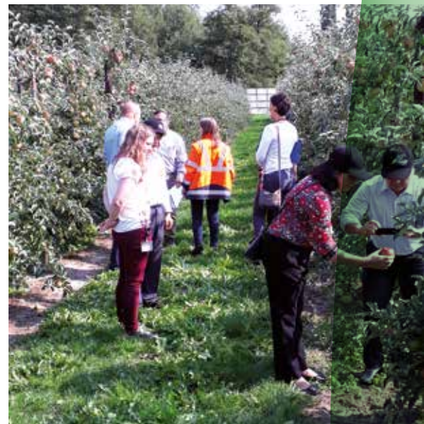
Inspectiebezoek Vietnamese delegatie