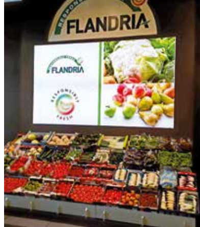
Fruit Logistica Berlijn

In het binnenland werd met de nieuwe campagne 'Heerlijk met witloof' in het najaar van 2018 witloof in de kijker gezet op het winkelpunt. Het witloof werd aangeprezen door andere voedingsproducenten (ambassadeurs). Naast de actie op het winkelpunt liep gelijktijdig een online-campagne op Facebook. Bovendien konden consumenten die aan de slag gingen met witloof meedoen aan een wedstrijd.