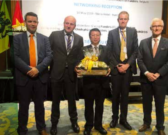
Economische missie Vietnam