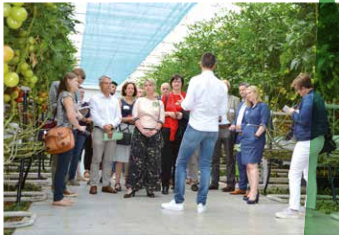
Voorstelling duurzaamheidsrapport Responsibly Fresh 2012-2018