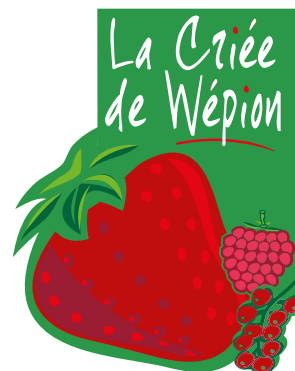
La Criée de Wépion