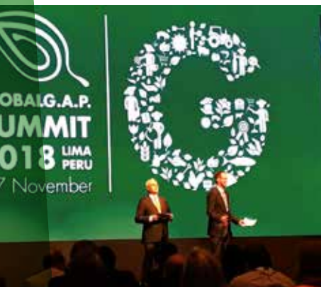
GLOBALG.A.P. Summit 2018 Lima/Peru

Om kwaliteitsvolle en veilige verse groenten en fruit te leveren conform de markt-vraag werken de coöperaties en hun aangesloten producenten traditioneel volgens één of meerdere kwaliteitssystemen. Voor de producentencoöperaties gaat het om de private kwaliteitsstandaarden van British Retail Consortium (BRC), International Food Standard (IFS) en Qualität und Sicherheit (QS), om de kwaliteitsborging via HACCP (Hazard Analysis Critical Control Points), ISO-normen (International Organization for Standardization) en Food Safety Management System (FSSC 22000) en om coöperatie-specifieke kwaliteitssystemen. Voor de producenten gaat het om de standaarden van GLOBALG.A.P. en Vegaplan. Zowel de coöperaties als de producenten passen ook de sectorgidsen autocontrole toe, gestuurd vanuit de wetgeving. Het VBT behartigt hierbij de belangen van de leden-coöperaties en hun aangesloten producenten om te komen tot enerzijds relevante en anderzijds haalbare en betaalbare systemen. Afhankelijk van het systeem is het VBT betrokken op bestuurlijk en/of inhoudelijk of technisch vlak.