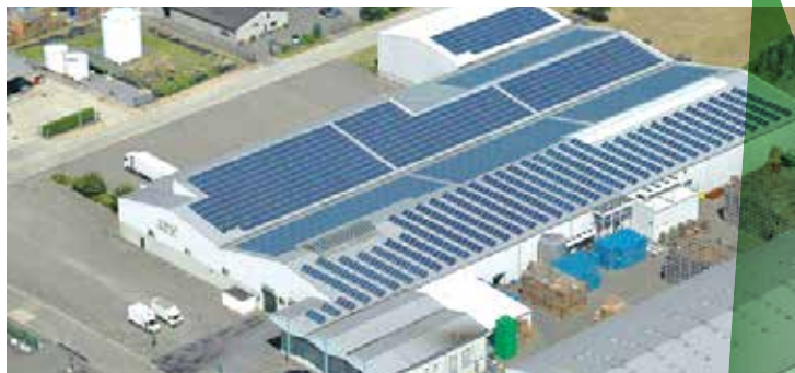
Limburgse Tuinbouwveiling (LTV)