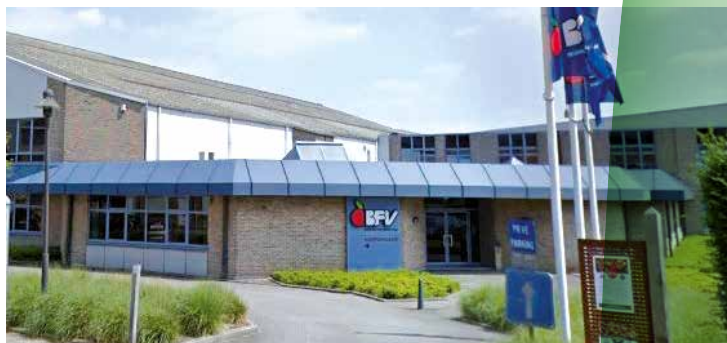
Belgische Fruitveiling (BFV)