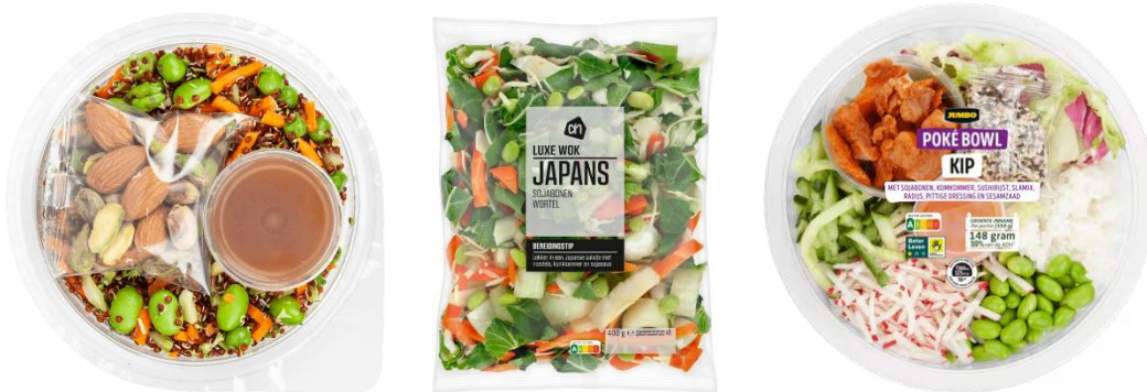
Figuur 2 Gemaksproducten met edamame boontjes