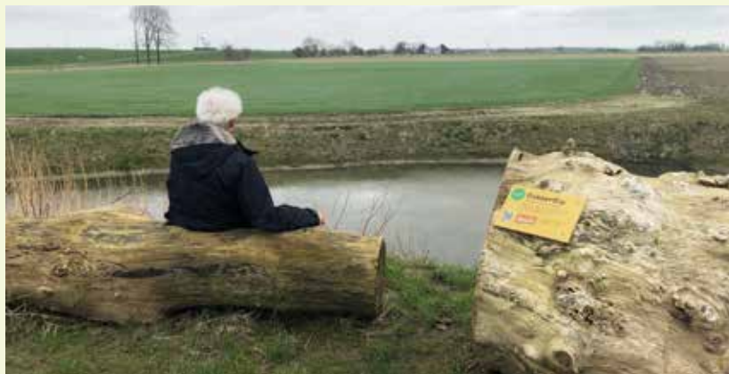
Poel west, met zicht op de boerderij.