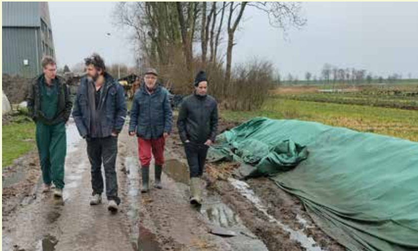
Rechts: CMC compost.

In de CMC methode wordt het materiaal in de eerste twee weken zeer regelmatig machinaal gemengd en direct weer afgedekt met compostdoek. Dit mengen vindt plaats zodra het gemeten CO 2 -gehalte in de hoop meer dan 16% is en de temperatuur meer dan 60-65 °C. Er wordt gedurende het proces geen nieuw materiaal bijgevoegd; alleen water als de hoop te droog wordt. De samenstelling van het uitgangsmateriaal is dus sterk bepalend voor de intensiteit van de behandeling. "De CMC compost is in