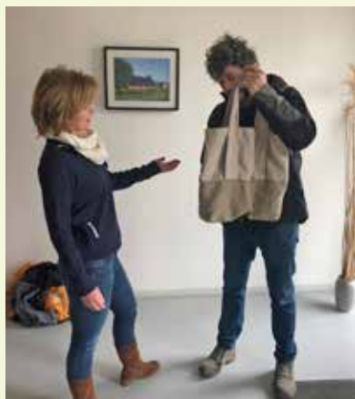
Een mooie linnen tas.