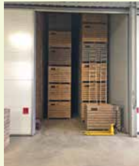
Netjes opgeruimd, kisten moeilijk bereikbaar.