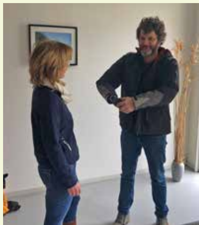
En daar sta je dan met je boodschappen!