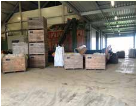
Kisten schots en scheef.

Zo heb ik een medewerker gevraagd om in de schuur de kisten netjes neer te zetten. Dan zie ik opeens dat de kisten allemaal keurig in de hoek gezet zijn, dicht op elkaar. Maar morgen komt er een vrachtauto, die geladen moet worden met een aantal van die kisten en dan is dat niet zo handig dat ze allemaal dicht op elkaar staan en de kisten die nodig zijn juist niet vooraan staan."