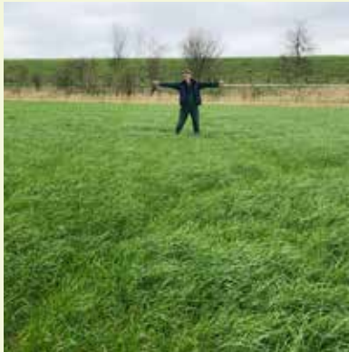
Hier was de sloot.

“We hebben een aansluitend gangbaar perceel aangekocht. Ons perceel loopt nu door tot aan de weg. De sloot ertussen hebben we dichtgegooid. Daar is beslist biodiversiteit verloren gegaan. Ik had toen het gevoel dat ik iets moest doen, maar ik wist nog niet wat. Maar ik wist wel dat er wat zou gaan gebeuren. We hebben uiteindelijk aan het uiteinde van die dichtgegooide sloot een tweede poel gegraven. Nu ligt aan de twee buitenkanten van het bedrijf elk één poel. Die poelen waren voor mijn gevoel nodig om balans in het bedrijf te brengen of te houden. De biodiversiteit van het perceel zelf is in ieder geval ook al toegenomen door onze bewerkingswijze.”