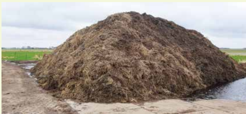
Ruim een maand later, na omzetten.