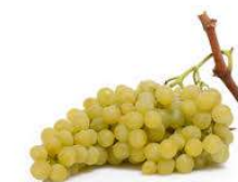
RAISIN SANS PÉPINS MILLENIUM