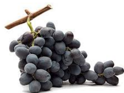
RAISIN AVEC PEPINS PALIERI