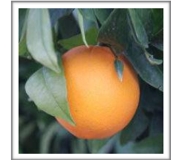
ROHDE SUMMER NAVEL