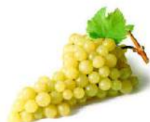
RAISIN AVEC PEPINS VICTORIA