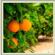
CHISLETT SUMMER NAVEL